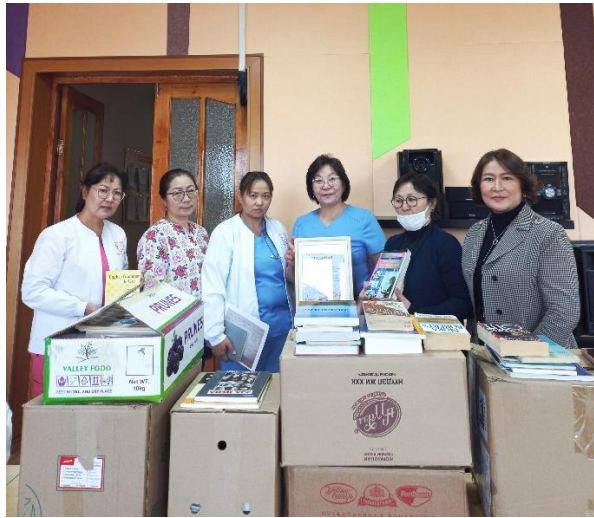
САЙН ҮЙЛСИЙН АЯН

Өнөөдөр нийслэлийн БГД-ийн тусгай хэрэгцээт иргэдийн “Түгээмэл хөгжил төв”-ийн хамт олонд ШУТИС-ийн багш, ажилтны хандивласан 142 номыг тус төвийн ажилтнуудад хүлээлгэн өглөө. Уг үйл ажиллагааг ГХС-ийн АСС-ын монгол хэлний багш нар санаачлан, ШУТИС-ийн хамт олноо ном хандивлах сайн үйлсийн аянд нэгдэхийг уриалан, зохион байгуулсан.